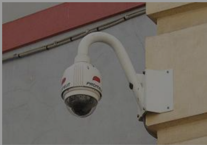
Interventi per migliorare il sistema di videosorveglianza

Mesi fa il comandante della Polizia municipale carcarese, Lorenzo Vassallo, aveva ammesso la necessità di potenziare il server, sia per mi-